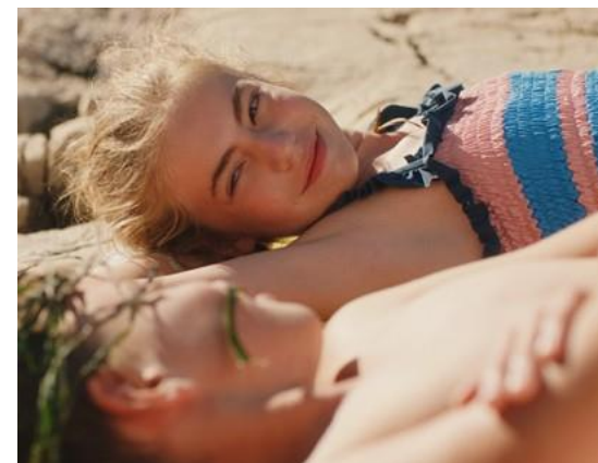
Lato, kiedy nauczyłam się latać