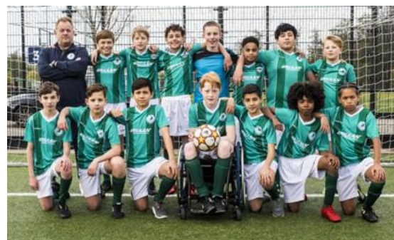
Mecz o wszystko